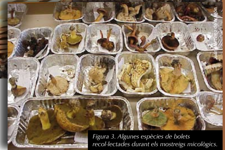
Figura 3. Algunes espècies de bolets recol·lectades durant els mostreigs micològics.

valor mitjà d'àrea basimètrica de 20 m 2 ha -1 (arribant a cobertura total de les copes i amb elevades taxes de creixement) maximitza la producció total i la diversitat de bolets (Figura 2). El desenvolupament d'aquest tipus d'informació i la seva integració en sistemes forestals de simulació-optimització permetrà incloure la gestió dels recursos micològics en sistemes de planificació multiobjectiu.